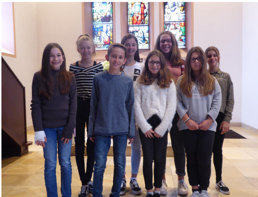
Die neuen Präparanden aus Morlautern

Am 23. September haben sich die neuen Präparanden unserer beiden Gemeinden in Morlautern und Erlenbach in einem Gottesdienst vorgestellt und diesen mitgestaltet.