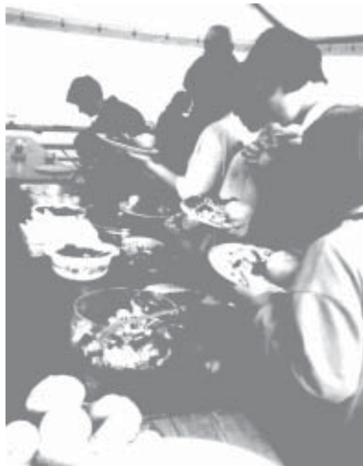
Essen wie im Mittelalter: Beim Ritterfest sich lustvoll den Bauch voll.

Da das Wetter sehr wechselhaft war und ständig dicke, schwere Wolken über das Turnerheim zogen und Regen brachten, verlegte man einige Spiele ins Innere des Turnerheims. Der Renner war der Schwerterkampf: Ein Schaumgummi-gefüllter Sack wird ans Ende eines Stockes gebunden. Die beiden Kämpfer mußten versuchen, ihren Gegner von einer Turnbank herunter zu schlagen. Wer gewonnen hat, bekam nach jedem Spiel einen „Ritterfest-Bon“, der am Ende gegen kleine Geschenke eingetauscht werden konnte. Beim Lanzenstechen mußten die Kinder versuchen, an Krepppapierstreifen aufgehängte Ringe mit einer Lanze aufzuspießen. Schwierigkeit: die Kinder saßen auf einem „Bobby-Car“ und wurden von einem Erwachsenen mit einer Schnur gezogen. Nach dem ersten abgestochenen Ring mußte eine 8 gefahren werden und auf dem Rückweg zum Ziel nochmals ein Ring getroffen werden. Zum Abendessen gabs ein Menü, das alle Anwesenden nach mittelalterlicher Art mit den Fingern essen durften: Knödel, Hähnchen, Rollbraten und Rotkraut. Daß das eigentlich gar nicht so kompliziert war, konnten die Kinder feststellen und schlugen