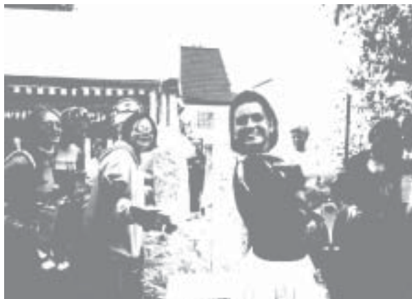
„Starlight-Express“ beim Umzug in Morlautern

Für viele Morlauterer fängt die Kerwe erst am Sonntag mit der Kerweredd so richtig an. Das Duo „Take Two“ sorgte abends für die richtigen Kerweklänge im Zelt. „Gell, bei euch ist noch alles in Ord- nung“ bemerkte ein Gast aus einem Nachbarort im Hinblick auf die gute Dorfgemeinschaft und die Hilfsbereit- schaft bei Veranstaltungen in Mor- lautern. Montags sammelten die Strauß- buben fleißig ihr wohlverdientes „Kerwegeld“ im Ort und als kleines Dan- keschön brachte der begleitende Musik- zug aus Erlenbach ein „Ständchen“ für die Morlauterer vom Schlachtenturm aus. Für den Montagabend forderten vie- le statt der Rockmusik doch lieber etwas Schunkel-und Stimmungsmusik zu ma- chen, „bei der man sich auch mal unter- halten kann“.