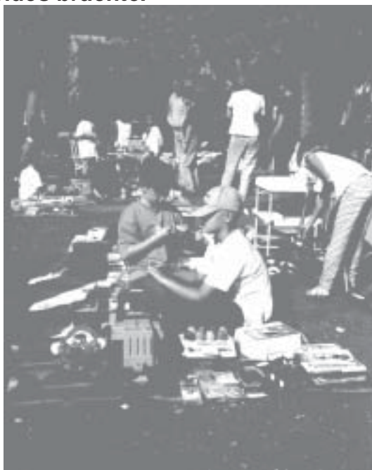
Zum ersten Mal dabei: Flohmarkt beim Handwerkermarkt

Der Handwerkermarkt am 24. September bot bei sonnigem Wetter einen Einblick in die Handwerksszene in Morlautern. Zum ersten Mal fand dabei auch ein Flohmarkt statt, der den Kindern eine Aufbesserung ihres Taschengeldes brachte.