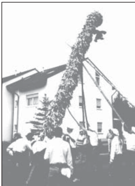
Die Straußbuwe beim „Straußstumbe“

E Määre aussem Dorf hot sich gedenkt, Ich mach moim Patekind mol e Geschenk. Ich lad de klää mol ins Kino in,