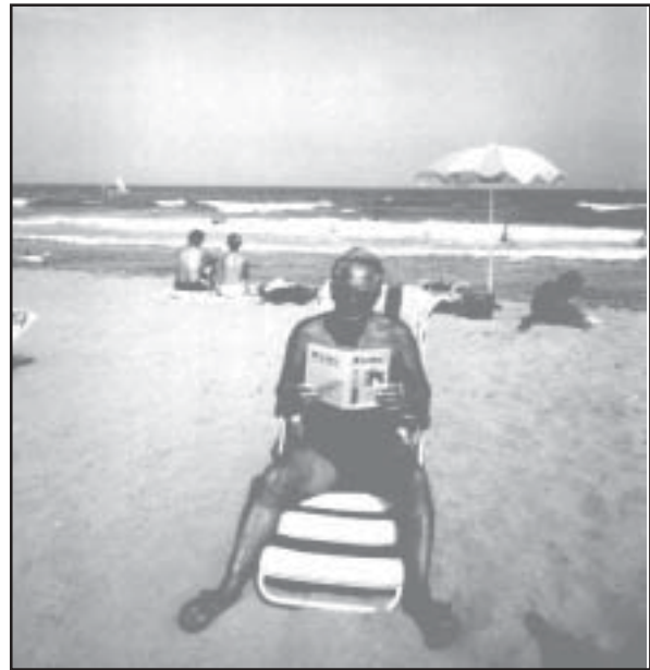
„Fritz“ wurde auch schon in Spanien gesichtet

Die Antworten des letzten Rätsels waren: 1. Ägypten, 2. Vulkan, 3. Anker, 4. Schneeballschlacht, 5. Mediziner, 6. Schlafmütze, 7. Augsburg und 8. Elster.